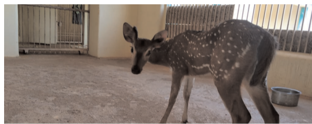
श्रमबिन्दु / दीपेश साहा

पखांचूर। पश्चिम भानुप्रतापपुर वन मण्डल, परिक्षेत्र कापसी, के अंतर्गत उप परिक्षेत्र पखांचूर के ग्राम पी व्ही 18 मायापुर में दिनांक 9 अगस्त 2024 को शाम 4 बजे महाराष्ट्र के आरक्षित वन से अपने झुंड से भटक कर एक नर हिरण उम्र लगभग दो-छाई वर्ष नागरिक आबादी क्षेत्र में पहुंच गया था जिसे पालतू कुत्तों द्वारा दौड़ाकर घायल किया जा रहा था। प्रबुद्ध नागरिकों के द्वारा भटकते वन्य जीव हिरण को कुत्तों से बचाया गया और तुरन्त वन विभाग को सूचना दिया गया। सूचना पाकर वन परिक्षेत्र अधिकारी देवदत्त तारम के द्वारा